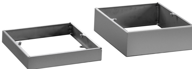
GREENFOND SK N nadstawka skrzynki kontrolnej